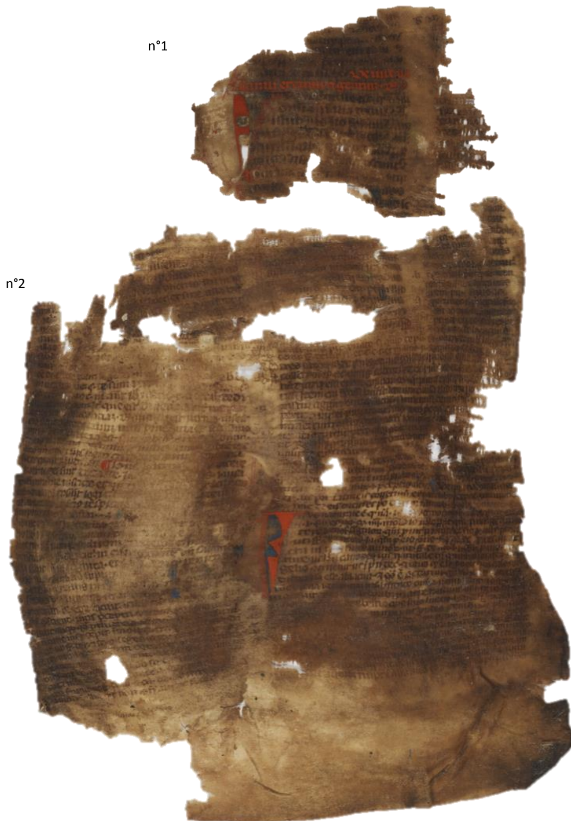
Fig. 1. Reconstruction : f. 1 recto