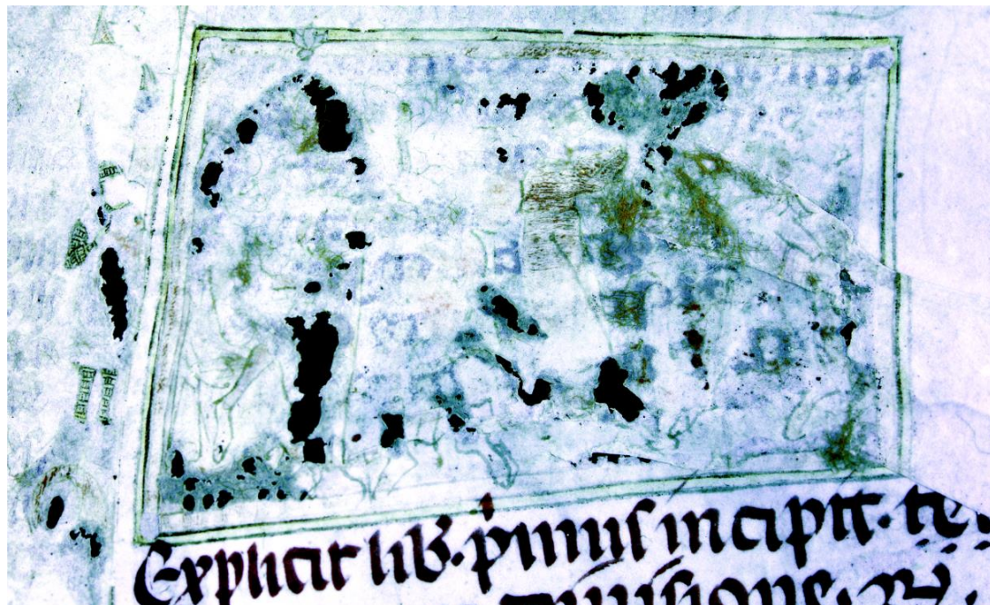
Comparaison iconographique : Troyes, BM 171, f. 10.