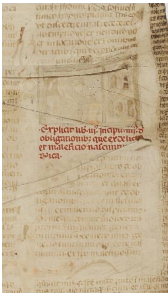
Fig. 7. Ms. 273, f. 51v : Justinien trônant (Livre 4). Comparaison de la miniature avec le décor du primo stile (Bologne, 3 e quart du XIII e s.) dans Angers, BM 339, f. 96v.